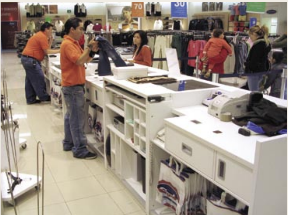
Muebles para tienda